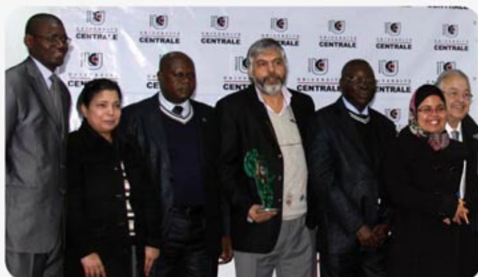
Photo souvenir lors de La cérémonie de signature de la convention