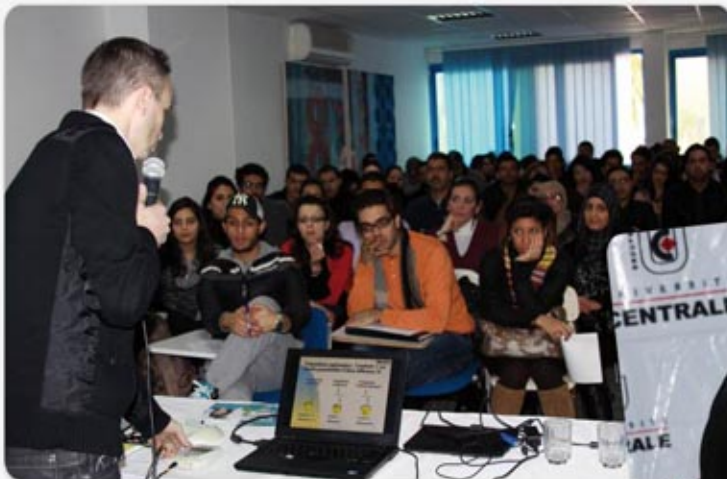
Des étudiants de la Centrale Santé très attentifs à l'exposé de l'animateur

La conférence a été suivie d'un atelier pratique, dans lequel l'audience a pu voir de près l'utilisation de l'appareil ainsi que son mode de fonctionnement. Certains ont même fait le cobaye.